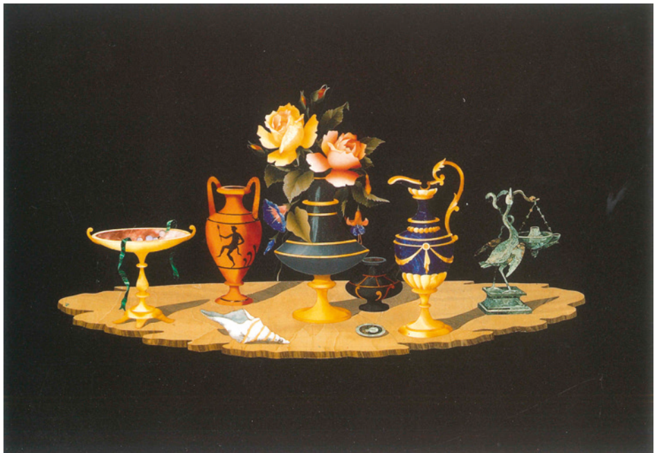
Composition identique provenant du Los Angeles County Museum of Art.

Le vase de style renaissance reprend la composition presque à l'identique du tableau du Los Angeles County Museum of Art, reproduit n°36 in « The Gilbert collection, Hardstones ». Ce mélange de style est typique des productions de la fin du XIX ème siècle.