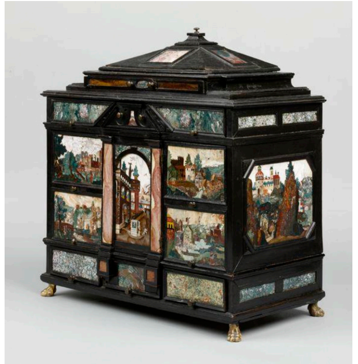
Cabinet décoré de pierres dures. Atelier Castrucci, vers 1610. Collection Gilbert, Victoria & Albert Museum.