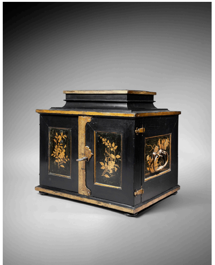
Vue fermé de ce précieux cabinet décoré de laque noire et or, à motif de bouquets de fleurs dorés à l'imitation de la Chine. XVII ème siècle, Augsbourg.