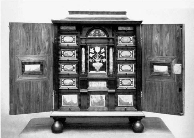
Cabinet décoré de pierres dures présenté au Château de Rosenborg, à Copenhague.